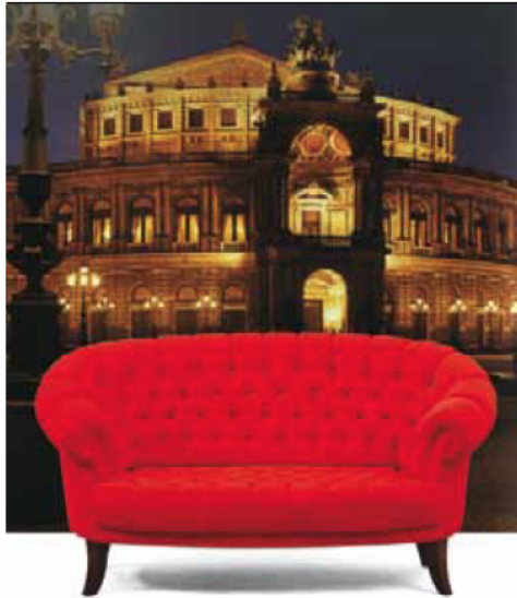
21 dieser Sofas prägen das Bühnenbild der Operetten-Inszenierung der Fledermaus in der Semperoper, Dresden.

Eine Symbiose von Kunst, Kultur und Polsterhandwerk.