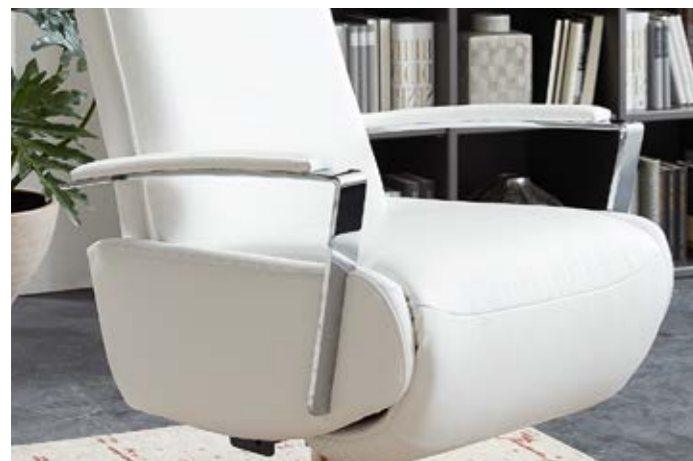
PERTH 2340 mit Chromarmlehne